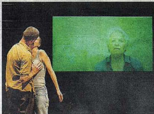
RACCONTA Installazione sulla vita quotidiana di Castello